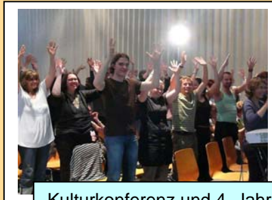
Kulturkonferenz und 4. Jahrestagung in Wiesbaden 2007