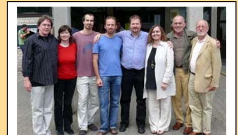
Erweiterter Vorstand seit 2007