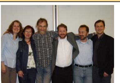
2. Jahrestagung in Heidelberg 2004

In Anwesenheit der DGB- Kulturpreisträger 2008