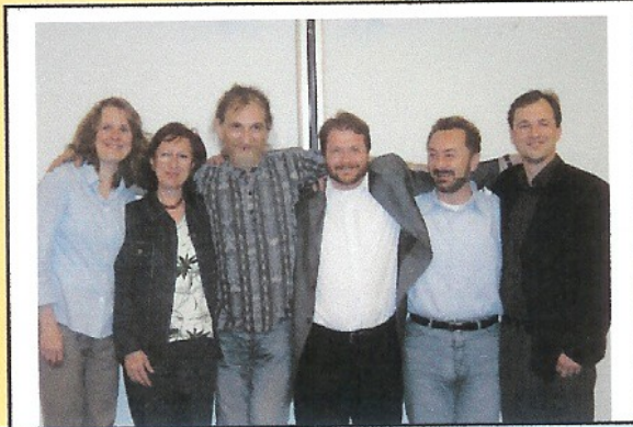
2. Jahrestagung in Heidelberg 2004