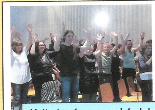
Kulturkonferenz und 4. Jahrestagung in Wiesbaden 2007