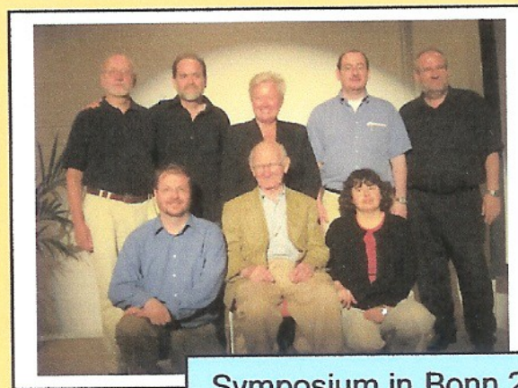
Symposium in Bonn 2005