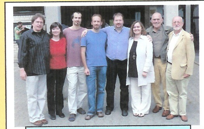
Erweiterter Vorstand seit 2007