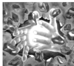
exposition Rudolf Werner